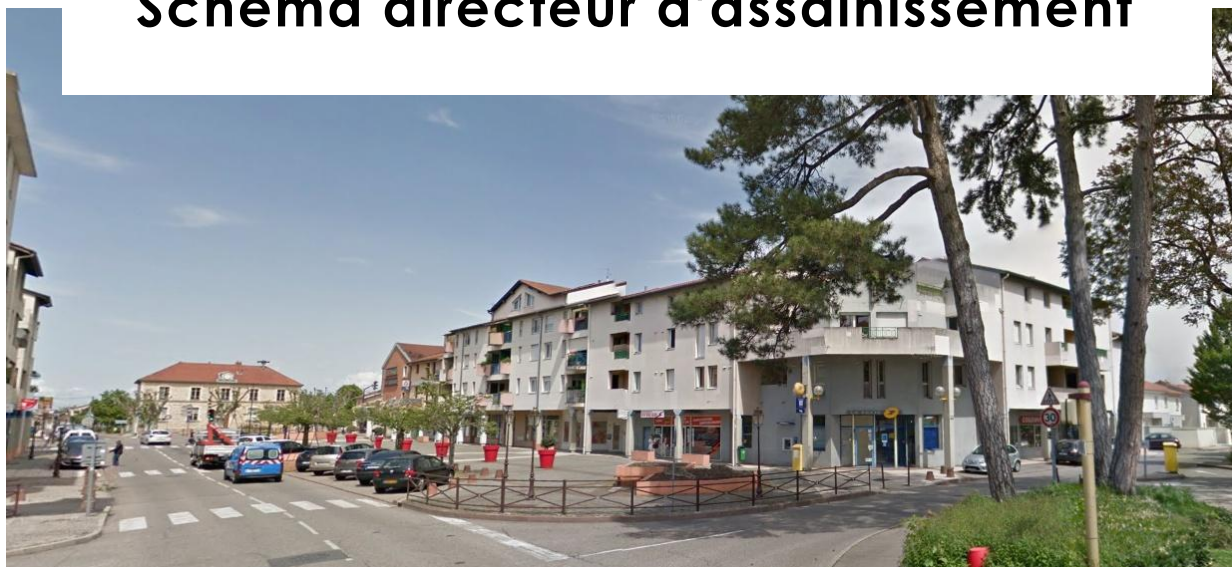
Schéma directeur d'assainissement