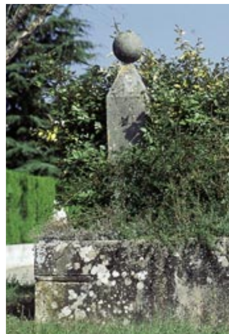
La fontaine de la rue Neuve appartient à notre patrimoine. Elle sera remise en valeur et fera office de rond-point