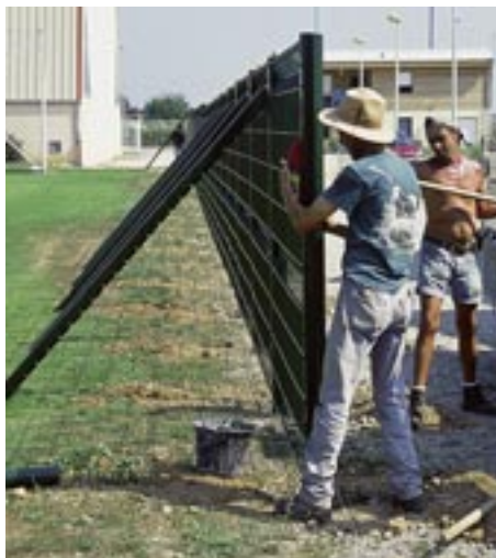
Les loisirs des jeunes ne sont pas oubliés. Ainsi, le complexe sportif va être clôturé

Par ailleurs, des études sont en cours en vue de l'extension des groupes scolaires.