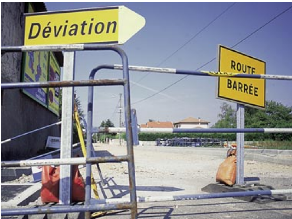
Fin des travaux du chemin de la Motte

A l'occasion de la rentrée scolaire, les travaux dans les écoles ont été une priorité, afin d'améliorer le bien-être des enfants. Deux chantiers importants sont d'ores et déjà achevés :