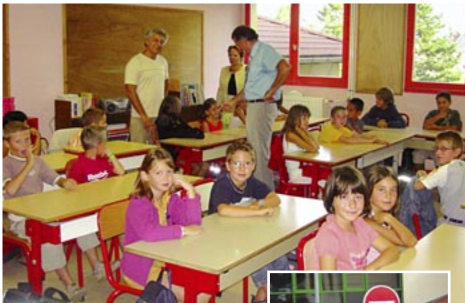
AU GROUPE SCOLAIRE VERCORS

La rentrée s'est effectuée sans difficulté dans les écoles de notre commune.