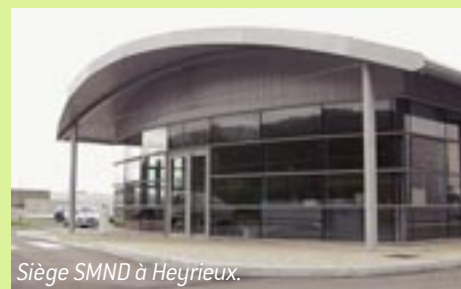
Siège SMND à Heyrieux.

Le Syndicat Mixte Nord Dauphiné a en charge la collecte et le traitement des déchets ménagers sur la commune. Sa mission de service public d'élimination des déchets répond aux obligations réglementaires et environnementales : l'interdiction de mise en décharge sans tri et valorisation (depuis juillet 2002), la valorisation au minimum de 50 % des emballages (depuis juin 2001) et d'au moins 50 % des déchets et le traitement des ordures ménagères dans le respect des normes environnementales.